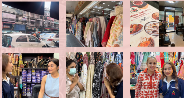
รูปภาพการลงชุมชนพาหุรัด

ได้ลองกินอาหารอินเดียครั้งแรก เป็นรสชาติที่แปลกใหม่ ปานิปูรี แป้งนานอินเดีย แกงถั่วลูกไก่กับแป้งสาลีทอด และยังได้กินขนมหวาน ราสมาลีย์ กุหลาบจามุน ชาโมซ่า ขนมทานเล่นของอินเดีย ที่ขายมานานกว่า30ปี