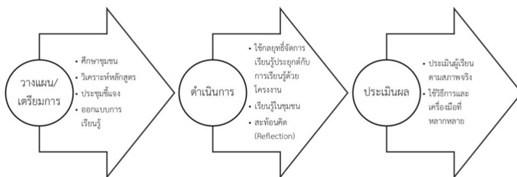
ภาพที่ 2 กระบวนการจัดการเรียนรู้โดยใช้ชุมชนเป็นฐาน