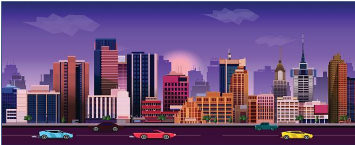
ภาพที่ 3 แสดงสภาพแวดล้อมชุมชนเมือง

3.2.4) เป็นแหล่งรวมของกิจกรรมต่างๆของการบริการด้านสาธารณูปโภค การศึกษาค้นคว้า และการพักผ่อนหย่อนใจ