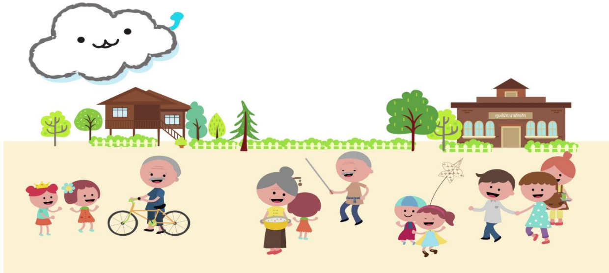
ภาพที่2 แสดงสภาพแวดล้อมสังคมชนบท