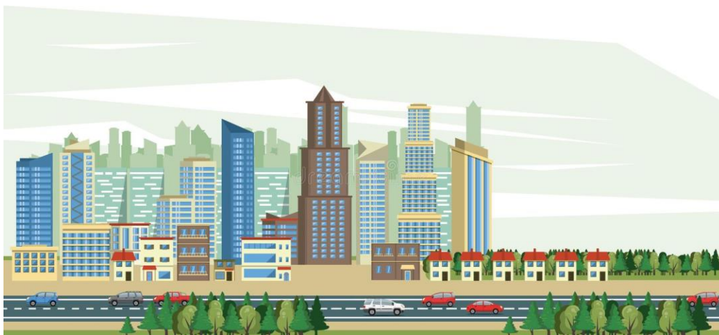
ภาพที่1 แสดงสภาพแวดล้อมสังคมเมือง