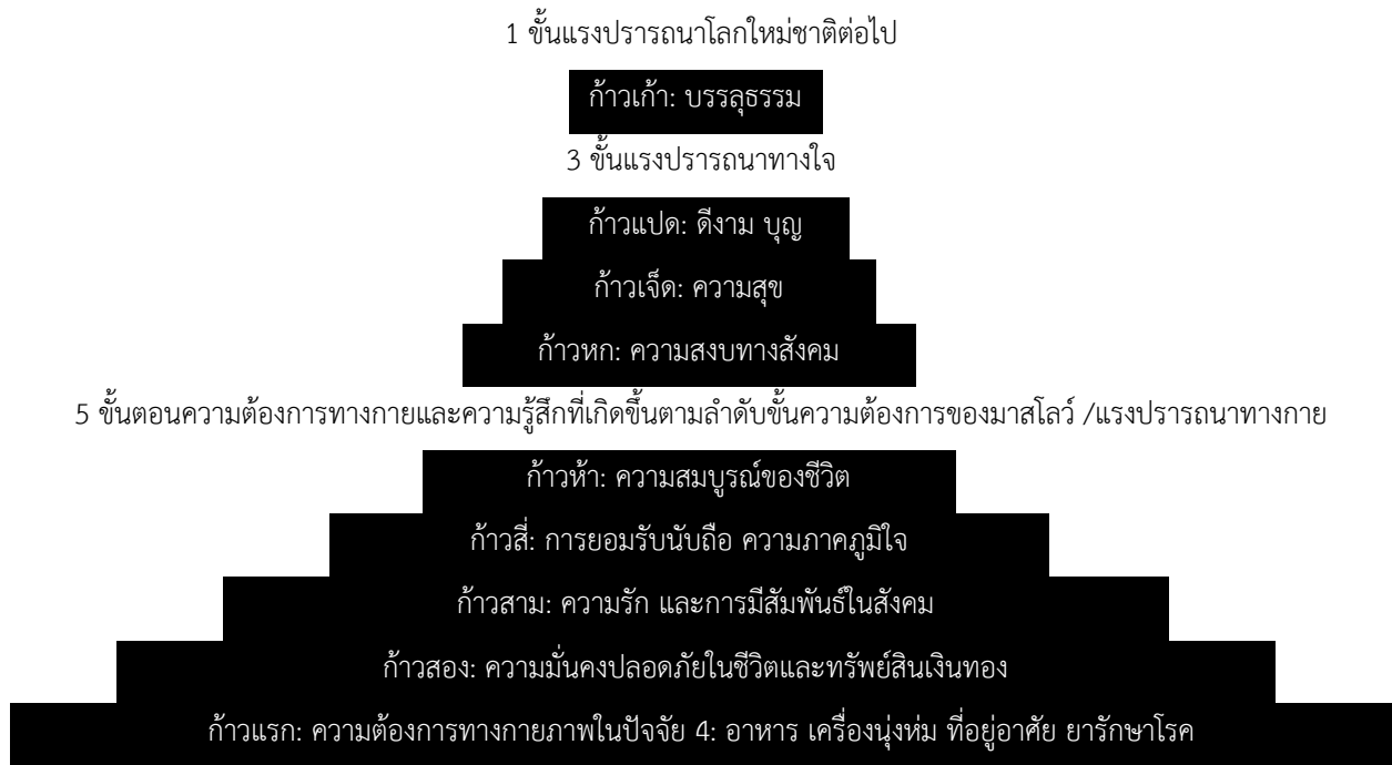
ภาพที่ 1.2 แนวคิด 9 ขั้นก้าวขึ้นตามแรงปรารถนาของมนุษย์