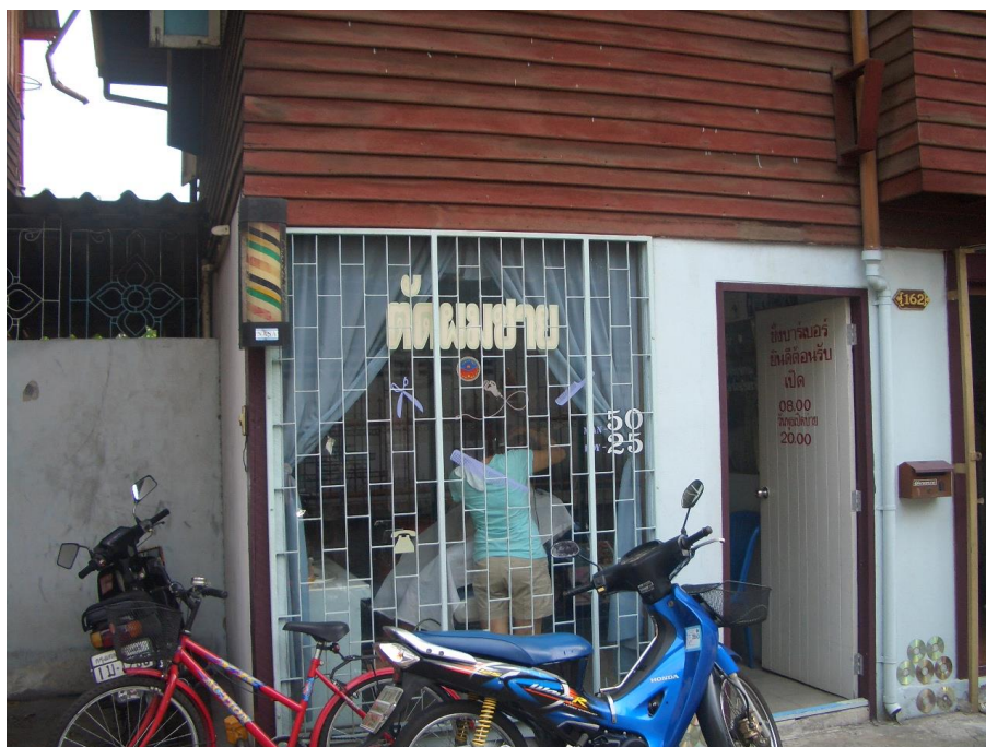
ภาพที่ 2.11 การประกอบอาชีพช่างตัดผมชาย เป็นอาชีพตัวอย่าง 1 ในหลายอาชีพของประชาชนชุมชนวัดประชาธิปไตย ธรรม 1

ส่วนอาชีพทำดอกไม้ประดิษฐ์จากสบู่นั้นเป็นอาชีพที่ดีของชุมชนจะส่งตามที่ลูกค้าสั่งมา และส่งตามร้านค้าทั่ว กรุงเทพมหานคร รวมถึงต่างจังหวัดด้วย