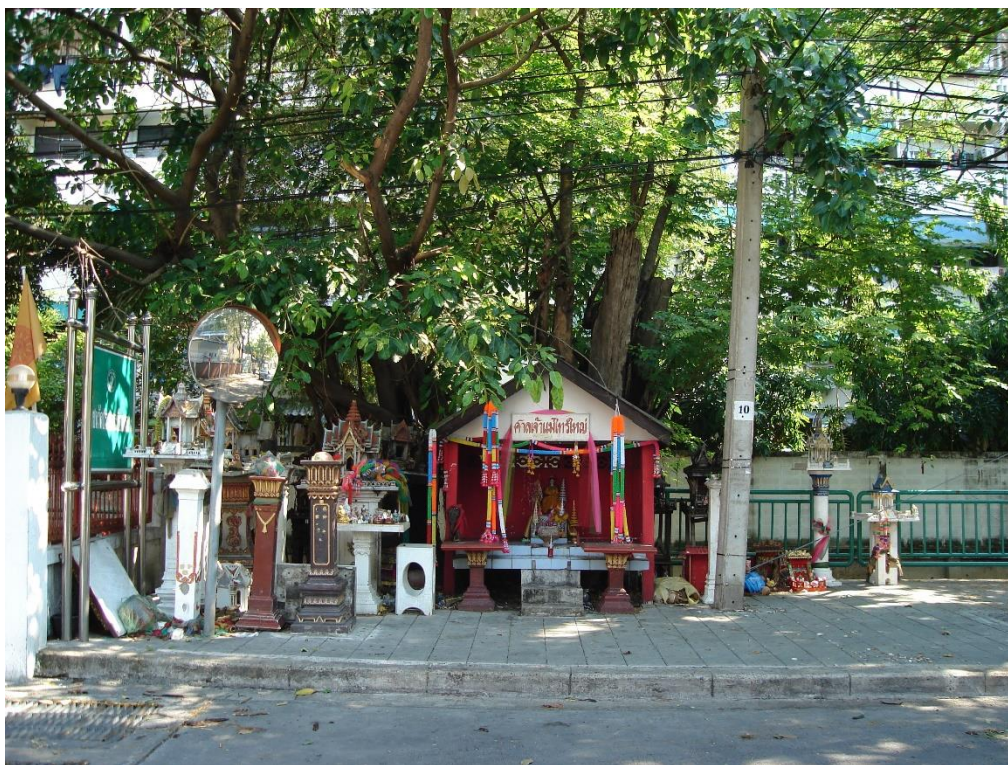
ภาพที่ 2.6 ศาลเจ้าแม่ไทรใหญ่ตั้งอยู่หน้าวัดพระอารามบือธรรม

การเข้าถึงชุมชนนั้นจะต้องข้ามสะพานวัดพระอารามบือธรรม และมีป้ายวัดพระอารามบือธรรมเป็นสัญลักษณ์ที่สำคัญในการบ่งบอก มีถนนคอนกรีต 2 เลน ชื่อว่า ชอยวัดพระอารามบือธรรมขนานกับคลองบางกระบือในการเข้าถึงชุมชนโดยใช้เส้นทางเดียวกันกับวัดพระอารามบือธรรม ที่ปากชอยจะมีวินมอเตอร์ไซด์รับจ้างอยู่ ถัดจากนั้นจะมีอาคารพาณิชย์ของประชาชนอยู่ริมติดกับถนนตรงข้ามกับคลองบางกระบือ และผ่านโรงเรียนวัดพระอารามบือธรรมซึ่งเป็นโรงเรียนสังกัดกรุงเทพมหานคร นอกจากนั้นก่อนถึงชุมชนวัดพระอารามบือธรรม 1 ยังพบว่ามีศาลเจ้าแม่ไทรใหญ่[ดังภาพที่ 4.4] สร้างเมื่อพ.ศ.2540 โดยประมาณ ตั้งอยู่หน้าวัดพระอารามบือธรรม ซึ่งศาลนี้เป็นที่เคารพของคนในชุมชนเฉพาะบางกลุ่มที่ชอบเสี่ยงทายเท่านั้น จึงทำให้ประชาชนในชุมชนส่วนใหญ่ไม่มีใครให้ความสำคัญมากนัก การได้ชื่อว่าชุมชนวัดพระอารามบือธรรม 1 เนื่องจากแต่ก่อนเป็นชุมชนเดียวคือชุมชนวัดพระอารามบือธรรม เป็นชุมชนใหญ่มีปัญหา ด้านการบริหาร การปกครอง การพัฒนาไม่ทั่วถึง และกรมการศึกษากินกว่าระเบียบกรุงเทพมหานครกำหนด ในปี 2538 จึงได้เสนอให้แบ่งเป็น 4 ชุมชน คือ ชุมชนวัดพระอารามบือธรรม 1, 2, 3 และ 4 ตามลำดับ