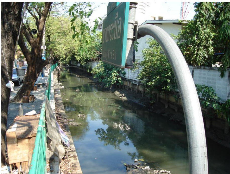
ภาพที่ 2.16 คลองบางกระบือ ไหลผ่านชุมชนวัดพระธาตูปืออธรรม 1 ที่มา: ชุมชนวัดพระธาตูปืออธรรม 1 [ถ่ายเมื่อวันที่ 6 เมษายน พ.ศ. 2552]

และไม่มีหน่วยงานไหนหรือคนในชุมชนให้ความสำคัญที่จะดูแลมากนัก เนื่องจากไม่มีประชาชนพูดถึงลำคลองที่ผ่านชุมชนเลย รวมถึงไม่มีป้ายรณรงค์ที่จะช่วยกันรักษาแม่น้ำลำคลอง ดังจะเห็นสภาพลำคลองดังภาพต่อไปนี้