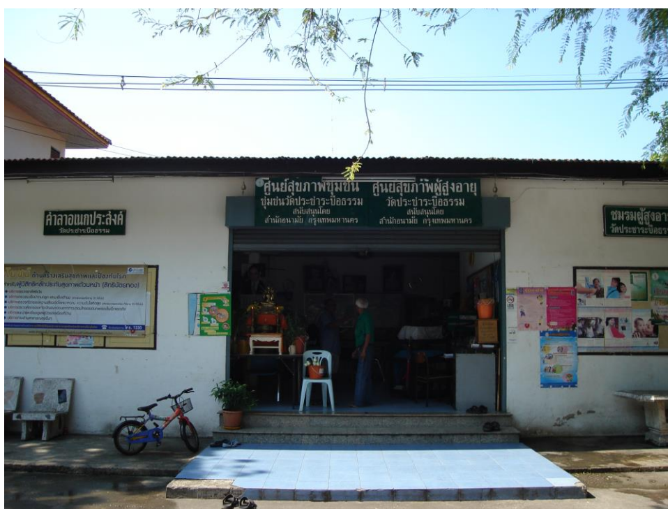
ภาพที่ 2.15 ศูนย์สุขภาพชุมชนและชมรมผู้สูงอายุชุมชนวัดพระธาตูปือธรรม 1 ที่มา: ชุมชนวัดพระธาตูปือธรรม 1 [ถ่ายเมื่อวันที่ 6 เมษายน พ.ศ. 2552]

ชุมชนวัดพระธาตูปือธรรม 1 จากการสำรวจข้อมูลพื้นฐานชุมชนพบว่า มีศูนย์สุขภาพชุมชนจำนวน 1 แห่ง ตั้งอยู่ภายในวัดพระธาตูปือธรรม ซึ่งศูนย์นี้จะเป็นที่จ่ายยาเบื้องต้นแก่ประชาชนที่เข้ามาตรวจสุขภาพ ซึ่งศูนย์นี้จะรวมอยู่ที่เดียวกับชมรมผู้สูงอายุของชุมชนด้วย ซึ่งแต่ก่อนเป็นอาคารเอนกประสงค์ของวัดพระธาตูปือธรรม และยังคงพบว่าในชุมชนมีลานกีฬา 1 แห่งโดยมีการจัดเป็นที่ออกกำลังกายทั้งแอโรบิคยามเย็นและการเล่นฟุตบอลของเยาวชนในชุมชน