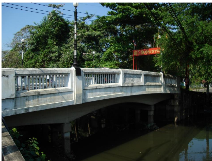
ภาพที่ 2.4 สะพานวัดประหาระบือธรรม สร้างเสร็จเมื่อ พ.ศ. 2516