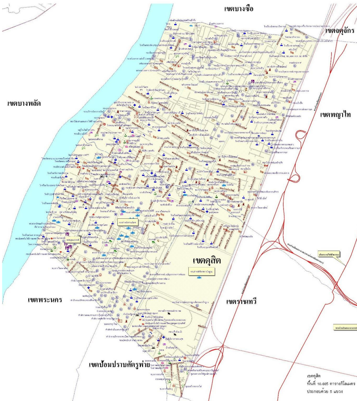
ภาพที่ 2.1 ขอบเขตพื้นที่ของเขตดุสิตในปัจจุบัน