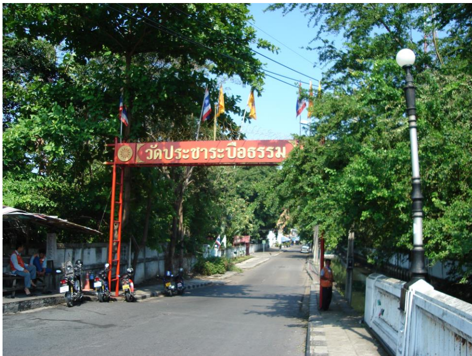
ภาพที่ 2.13 ถนนทางเข้าชุมชนวัดประหาระบือธรรม 1

[ถ่ายเมื่อวันที่ 6 เมษายน พ.ศ. 2552]