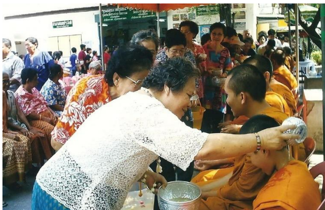
ภาพที่ 2.18 สืบสานประเพณีบุญวันสงกรนนต์ชุมชนวัดประหาระบือธรรม 1 ที่มา: ชุมชนวัดประหาระบือธรรม 1 [ถ่ายเมื่อวันที่ 13 เมษายน พ.ศ. 2552]

ส่วนงานศพ ประชาชนจะไม่ได้จัดงานที่วัดประหาระบือธรรม เนื่องจากที่วัดไม่มีเมรุในการเผาศพ เมื่อมีคนเสียชีวิตในชุมชน จะนำศพไปประกอบพิธีกรรมทางศาสนาที่วัดจันทรสโมสรรเป็นส่วนใหญ่