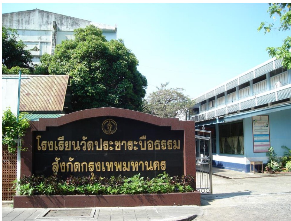
ภาพที่ 2.14 โรงเรียนวัดพระอารามบือธรรม สังกัดกรุงเทพมหานคร ตั้งอยู่ในชุมชนวัดพระอารามบือธรรม 1 แหล่งที่มา : ชุมชนวัดพระอารามบือธรรม 1 (ถ่ายเมื่อวันที่ 6 เมษายน พ.ศ. 2552)

ชุมชนวัดพระอารามบือธรรม 1 มีสถานศึกษาตั้งอยู่ในชุมชน ได้แก่ โรงเรียนวัดพระอารามบือธรรม เป็นโรงเรียนสังกัดกรุงเทพมหานคร ซึ่งตั้งขึ้นเมื่อวันที่ 1 มีนาคม พ.ศ. 2475 โดยขุนสารภีราษฎร์บริรักษ์ นายอำเภอ เขตคูสิต และนายบรรณกิจ ท้าวสัน ซึ่งได้ขออนุญาตต่อเจ้าอาวาสวัดพระอารามบือธรรม เพื่อจัดตั้งโรงเรียนในเนื้อที่ 4 ไร่ 1 งาน 12 ตารางวา ใช้ชื่อโรงเรียนประชาบาล ถนนนครไชยศรี ปี พ.ศ. 2480 ได้โอนให้แก่เทศบาลนคร กรุงเทพมหานคร ได้ชื่อว่า โรงเรียนเทศบาล ปี พ.ศ. 2496 เทศบาลนครกรุงเทพไดโอนโรงเรียนให้กับกรมสามัญศึกษา มีสภาพเป็นโรงเรียนประชาบาล และได้เปลี่ยนชื่อว่า โรงเรียนวัดพระอารามบือธรรม จนถึงปัจจุบัน มีอาคาร 3 หลัง อาคารละ 3 ชั้น อาคารสำนักงาน 1 หลัง อาคารอเนกประสงค์ 2 ชั้น 1 หลัง โรงอาหาร 1 หลัง บ้านพักภารโรง 2 หลัง หอสมุดกาญจนาภิเษก 1หลัง ปัจจุบัน นางจิราภรณ์ วงษ์ขำ เป็นผู้อำนวยการ จัดการเรียนการสอนตั้งแต่อนุบาล ถึงระดับประถมศึกษาปีที่ 6 มีจำนวนนักเรียนประมาณ 763 คน