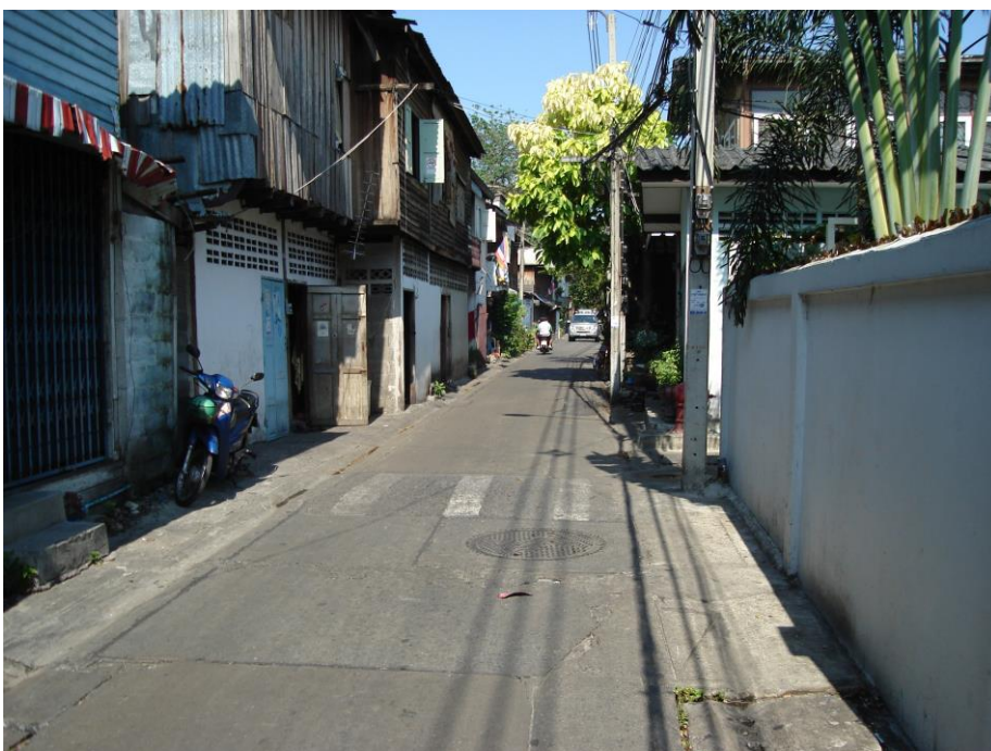
ภาพที่ 2.9 ลักษณะที่อยู่อาศัยแบบบ้านไม้ดัดแปลง

ที่มา: ชุมชนวัดประหาระบือธรรม 1 [ถ่ายเมื่อวันที่ 5 เมษายน พ.ศ. 2552]