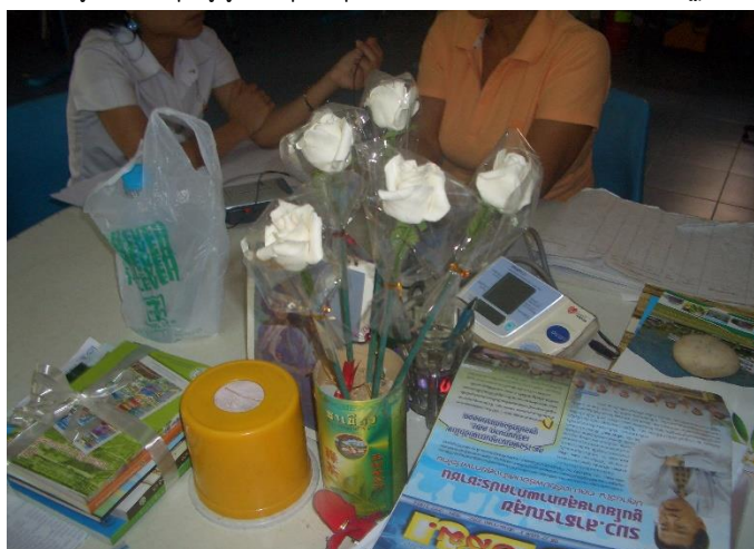
ภาพที่ 2.19 การทำดอกไม้สดของชุมชนวัดพระธาตุนคร 1

เมื่อกล่าวถึงศิลปกรรมประเภทประติมากรรม งานปั้นหรืองานแกะสลักในชุมชนที่สืบทอดกันมาแต่อดีต มีอยู่ 2 ประการ ได้แก่ การทำดอกไม้สด และการร่อนทอง ปัจจุบันนี้การร่อนทองไม่ปรากฏมีผู้สืบทอดมา ส่วนที่ปรากฏชัดเจนในปัจจุบันยังคงทำกันอยู่ โดยกลุ่มผู้สูงอายุในชุมชนคือ การทำดอกไม้ประดิษฐ์จากสบู่ (ดังภาพที่ 2.19)