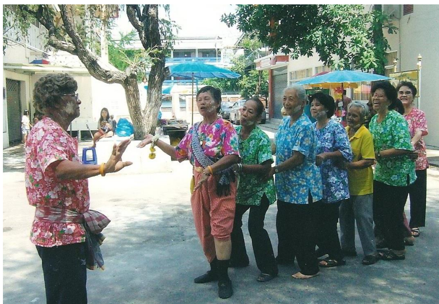
ภาพที่ 2.20 การละเล่นงูกินหางของชุมชนวัดประหาระบือธรรม 1

ส่วนกิจกรรมอื่นในชุมชนได้การแข่งขันกีฬาในสนามของคนในชุมชนที่จัดกันมากที่สุด คือ การแข่งขันฟุตบอล ของคนในชุมชนนั่นเอง ซึ่งการละเล่นหรือกิจกรรมต่าง ๆ ที่ชุมชนช่วยกันจัดเพื่อให้เกิดความสนุกสนานผ่อนคลายความเครียดและพักผ่อนหย่อนใจ