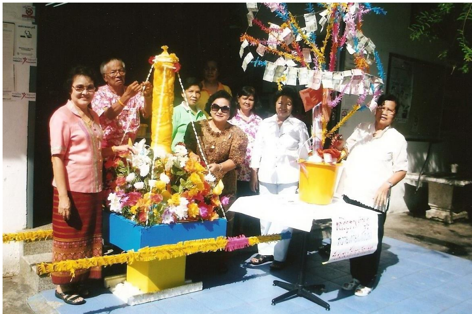
ภาพที่ 2.17 สืบสานประเพณีบุญวันเข้าพรรษาชุมชนวัดประหาระบือธรรม 1 [ถ่ายเมื่อวันที่ 18 กรกฎาคม พ.ศ. 2551]

ประเพณีที่ชุมชนได้ดำรงมั่นคงไว้เป็นหลักให้กับประชาชนในชุมชนได้มีส่วนร่วมกันทำบุญกันอย่างขงใหญ่ และยังคงยึดถือตราจกนทุกวันนี้ ได้แก่ ประเพณีวันสงกรนนต์ จดัขึ้นที่วัดประหาระบือธรรม ในวันที่ 13-15 เมษายน ของทุกปี ในงานจะมีการทำบุญตักบาตร สรงน้ำพระ รดน้ำคำหัวของพระผู้สูงอาขุ ทำบุญอุทิศส่วนกุศลแด่บรรพบุรุษและผู้มีพระคุณทุกท่น โดยงานจัดตั้งแต่เช้าถึงเวลาเย็นทุกวัน ส่วนประเพณีทำบุญตักบาตรวันปีใหม่ ประชาชนจะนิมนต์พระสงฆ์ในบริเวณ ใกล้เคียงให้เพียงพอต่อความต้องการในปีนั้น ๆ เช่น 80 รูป เนื่องในปีเฉลิมพระชนมพรรษาของพระบาทสมเด็จพระเจ้าอยู่หัว เป็นต้น โดยประชาชนจะจัดเตรียมข้าวสารอาหารแห้งมารอเรียงรายตามทางที่กรรมการชุมชนได้จัดเตรียมให้พระสงฆ์รับปถนทบาต หลังจากนั้นประชาชนก็พากันรับศีลรับพรตามประเพณีนิยม เพื่อความเป็นสิริมงคลแก่ชีวิตและครอบครัวในการดำเนินชีวิตในปีใหม่และตลอดปีต่อไป