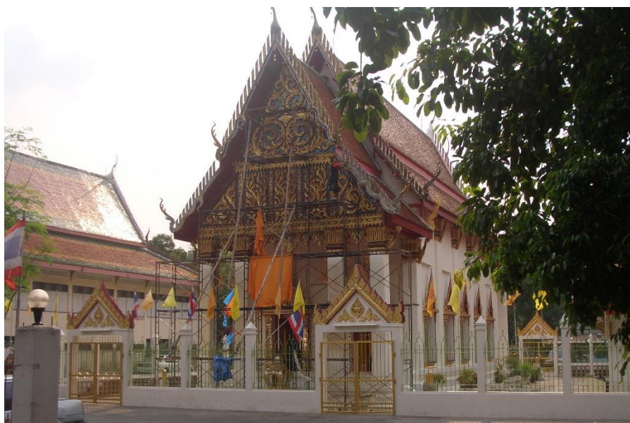
ภาพที่ 4.2 วัดพระอารามมณีธรรม

วัดพระอารามมณีธรรมสร้างเมื่อ พ.ศ. 2440 โดยมีบิดาของพระภิกษุคง และญาติ ได้ซื้อที่ดินและสร้างวัดขึ้นแล้วขนานนามว่า “วัดบางกระบือ” เนื่องจากคลองโดยรอบบริเวณวัด ชาวบ้านนำกระบือมาเลี้ยงกันมาก และเรียกคลองนี้ว่า “คลองบางกระบือ” เมื่อได้สร้างวัดขึ้นแล้วจึงเรียกนามวัดตามลักษณะภูมิประเทศที่ตั้งวัดไปด้วย ต่อมาประชาชนได้ร่วมกันบูรณะพัฒนาวัดจนเจริญรุ่งเรืองตามลำดับ จึงได้เปลี่ยนนามวัดใหม่ให้มีความหมายไพเราะยิ่งขึ้นว่า “วัดพระอารามมณีธรรม” และยังเป็นศูนย์รวมจิตใจของประชาชนใน 4 ชุมชน มาเป็นเวลากว่า 112 ปี ทุกรายจนทุกวันนี้