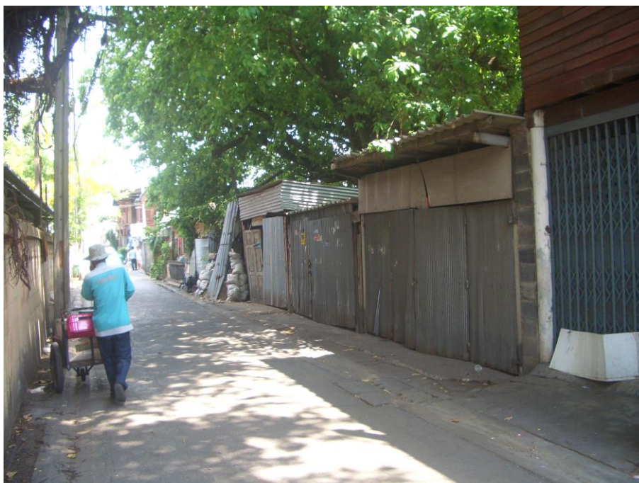
ภาพที่ 2.10 ลักษณะที่อยู่อาศัยแบบที่ปักอาศัยชั่วคราว