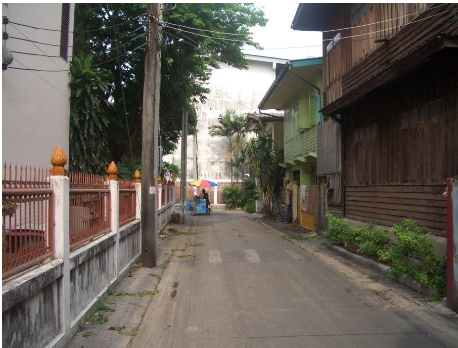
ภาพที่ 2.8 ลักษณะที่อยู่อาศัยแบบบ้านไม้ 2 ชั้น

ที่มา: ชุมชนวัดประหาระบือธรรม 1 [ถ่ายเมื่อวันที่ 5 เมษายน พ.ศ. 2552]