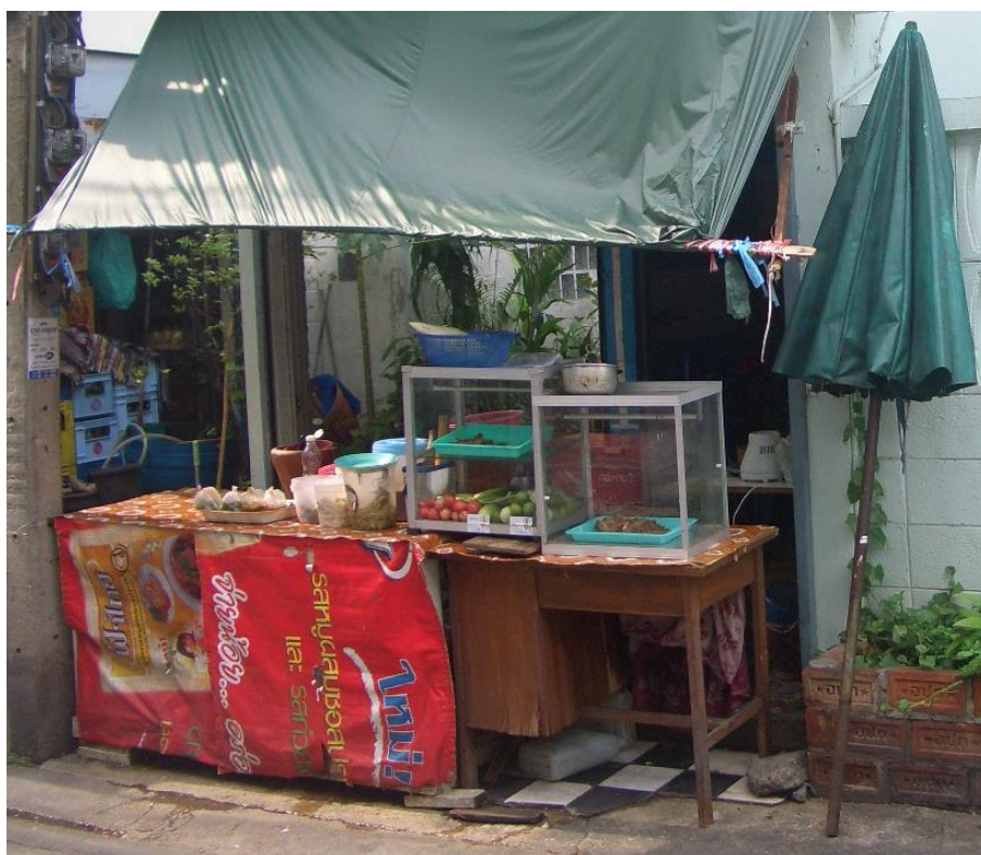
ภาพที่ 2.12 ร้านขายอาหารส้มตำภายในชุมชน เป็นอาชีพตัวอย่าง 1 ในหลายอาชีพของประชาชนชุมชนวัดประชา ระบือธรรม 1

มากนัก และชนิดของอาหารไม่เป็นการประจำ เช่น อาหารตามสั่ง และโอกาสที่จะร่วมรับประทานอาหารกันครบทุกคนในครอบครัวมักจะไม่ใคร่มีโอกาสมากนัก อาหารที่ประชาชนในชุมชนรับประทานอาหารกันทั่วไป ได้แก่ ผักกวนน้ำพริกปลาทุ แกงส้ม ปลาทอด ไช้เจียว เป็นต้น ส่วนอาหารตามสั่งมักจะเป็นจำพวกอาหารจานเดียว ได้แก่ ผัดกระเพรา ข้าวผัด ผัดคะน้าหมูกรอบ เป็นต้น ซึ่งอาหารเหล่านี้เป็นอาหารไทยทั่วไปที่ทุกคนรับประทานกัน และมีร้านอาหารที่ขายเฉพาะอาหารภาคอีสาน เช่น ร้านส้มตำ เป็นต้น จากการบริโภคอาหารของประชาชนในชุมชนที่หลากหลายจนสามารถบอกได้ว่าชุมชนประชากรระบือธรรม 1 ได้ถูกความเป็นเมืองกลืนในแทบทุก ๆ ด้าน กระทั่งการบริโภคอาหารของตัวเองและครอบครัวที่ต้องใช้เวลาประกอบอาหารที่นาน ๆ และการรับประทานอาหารร่วมกันได้จึงจางลงไปทุกวันและพร้อมที่จะหายไปพร้อมกับความเป็นเมืองที่กลืนวิถีชีวิตชุมชนอันดั้งเดิมให้หายไปด้วย