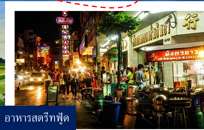
อาหารสตรีทฟู้ด