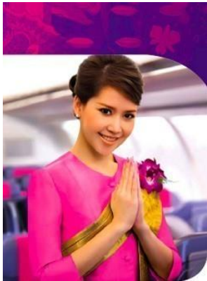
การไหว้ทักทาย

ไหว้ทักทาย, ท่องเที่ยวป่าผจญภัย การค้าขายชายแดน, เดินทางไปพม่า