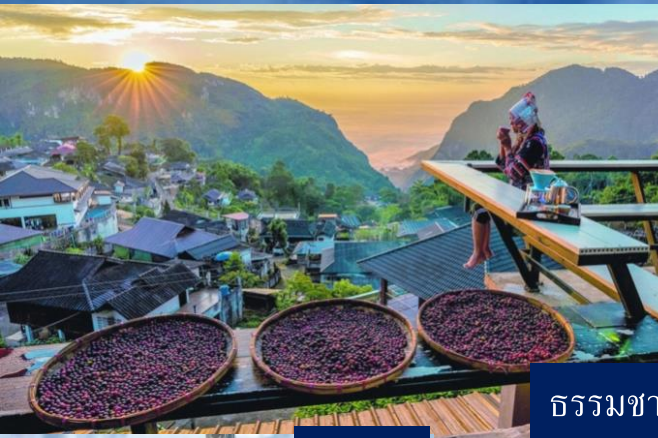
ธรรมชาติ