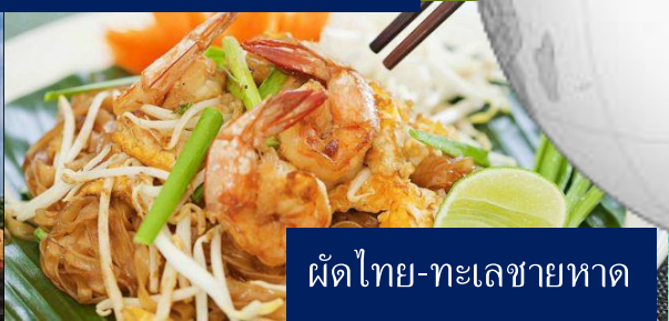
ผัดไทย-ทะเลชายหาด