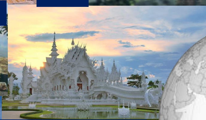
วัดร่องขุ่น/พระธาตุพนม-ดอยสุเทพ