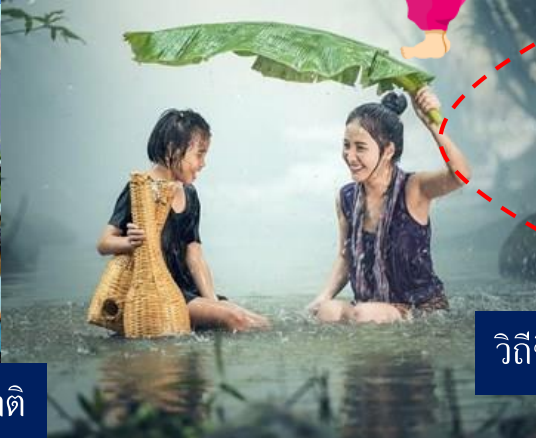
วิถีชีวิต