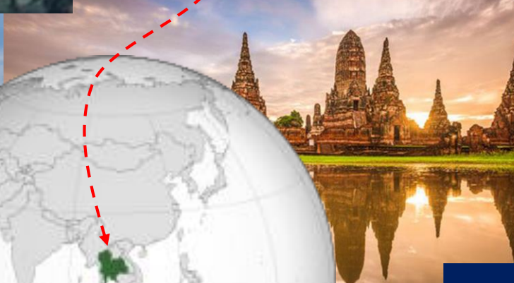
อยุธยา/พระราชวัง/วัดพระแก้ว