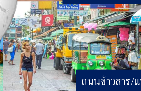
ถนนข้าวสาร/แหล่งท่องเที่ยว