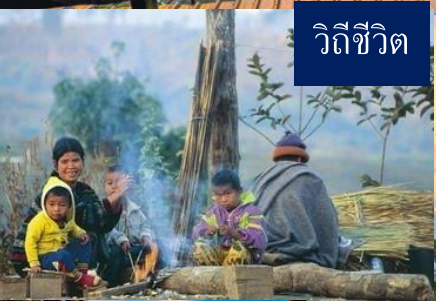
วิถีชีวิต