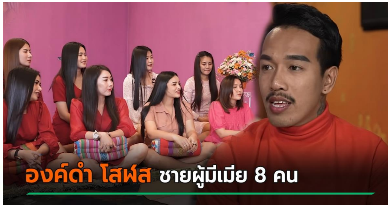
องค์ดำ โสฬส ชายผู้มีเมีย 8 คน

“สามีเป็นช้างเท้าหน้า ภรรยาเป็นช้างเท้าหลัง” หมายถึง สามีคือผู้นำครอบครัว ภรรยาคือผู้ตามที่ดี