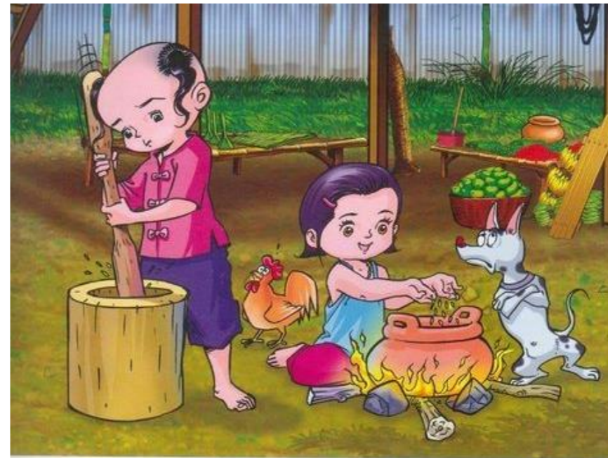
ทำงานแค่ให้เสร็จไปครึ่งหนึ่ง ๆ หรือทำแค่พอกินไปวันหนึ่ง ๆ คนสมัยก่อนจะคั้นน้ำข้าวเปลือกมาตำเอาเปลือกออก ร่อนเอาเฉพาะข้าวสาร แล้วจึงนำไปหุงกิน คนซึ่งเกียจจะตำข้าวเปลือกแค่พองกินได้มือเดียวเท่านั้น พองจะกินมือหน้าก็ค้อยตำเอาใหม่